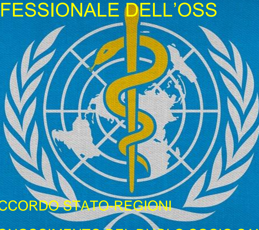
FIGURA PROFESSIONALE DELL'OSS